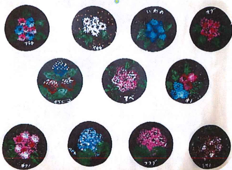
フキフキを使って着色