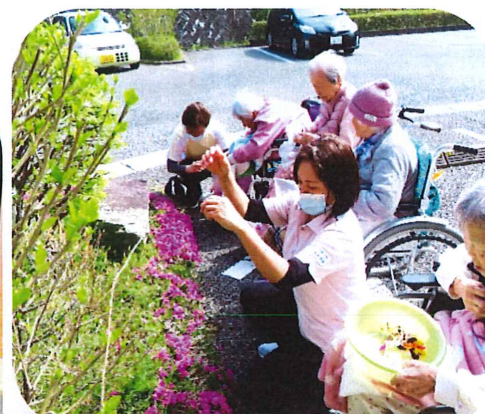
押し花づくり～ハガキ～