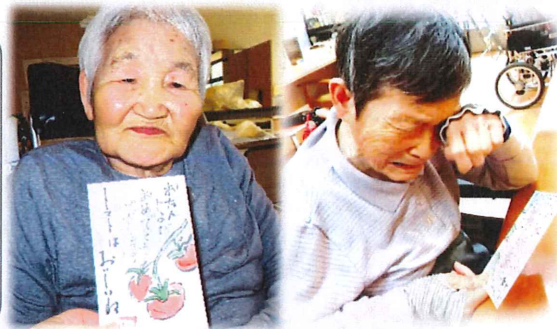
誕生日に絵手紙を贈る活動を続けています