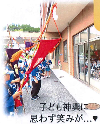
子ども神輿に 思わず笑みが...♥

八旗八幡神社、若宮八幡神社よりお神輿がきました。コロナ対策のため残念ながら窓越しでの対面となりましたが、神事・獅子囃みのご利益を受け「ワッショイ！ワッショイ！」の声に心躍る様子が見られました。皆さま本当にありがとうございました！