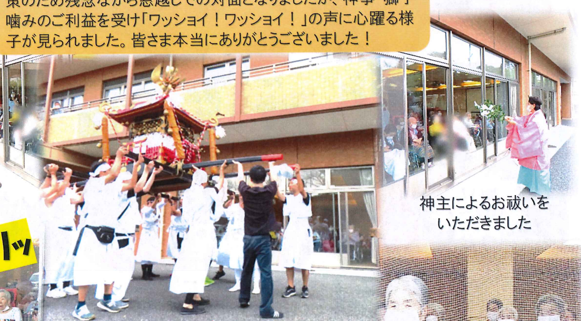
神主によるお祓いを いただきました